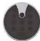
Bezdrátová klávesnice s elektronickým klíčem WK02 2-kanál 433MHz