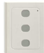
Bezdrátová klávesnice WWS01 3-kanál 433MHz