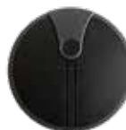
Bezdrátové tlačítko WWS03/868 2-kanál 868MHz