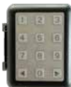
Bezdrátová klávesnice WK01/868 2-kanál 868MHz