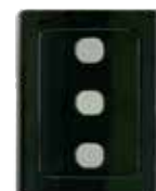
Bezdrátová klávesnice WWS01/868 3-kanál 868MHz