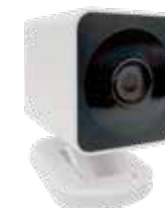
Smart kamera F-CAM 20206013