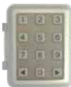
Bezdrátová klávesnice WK01 2-kanál 433MHz