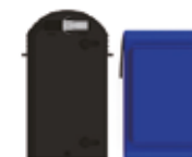
Záložní baterie BB04