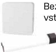
Bezdrátové jištění vstupních dveří SD02